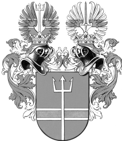
Das Ritterstands-Wappen für Ernst Ritter von Lauda. Niki Laudas Urgroßvater Ernst wurde 1916 von Kaiser Franz Joseph in den Adelsstand erhoben.

Die vorliegende Biografie entwirft ein Lauda-Porträt fernab von bloßer Lobhudelei und banaler Sporthelden-Saga. Sie will das komplexe und deshalb auch angreifbare Bild des Menschen Andreas Nikolaus Lauda vor uns entstehen lassen. Des Mannes unter der Kappe, des Weltmeisters, Helden, Spormeisters, Medienprofis und Machtmenschen. Aber auch das Bild eines Mannes mit Familiensinn, großzügig, höflich, ehrlich. „Alles unter einer Kappe“ begibt sich auf die Spurensuche nach dem Ursprung dieser Vielfalt.