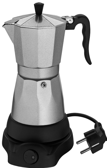
elektrischer Espressokocher »Classico« Bedienungs- und Pflegeanleitung