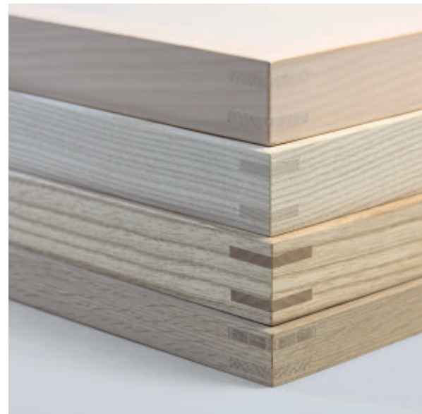
9 Naturholzleisten in unterschiedlichen Höhen und Breiten