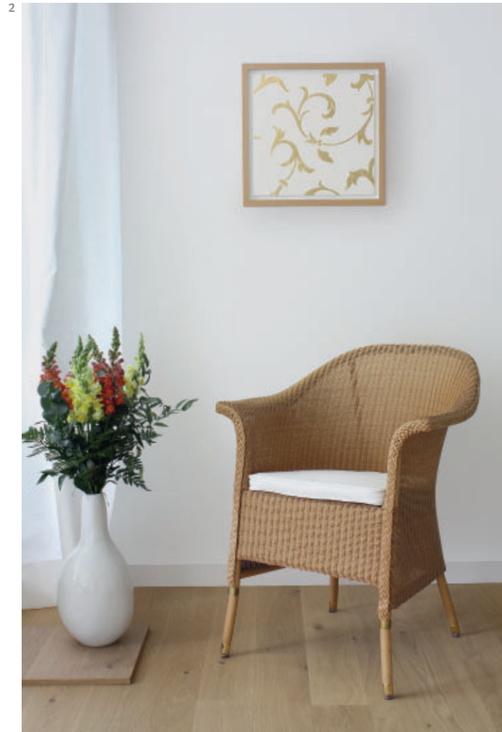
2 Aufeinander abgestimmt: Rahmen und Möblierung

Oftmals wird nach der Präsentation ein Bild gemäß Kundenwunsch individuell gerahmt. Entscheidet sich der Kunde für einen Holzrahmen, so lässt das Angebot der Rahmenindustrie keinen Wunsch offen. Die Holzart sieht immer harmonisch aus, wenn der Rahmen, der natürlich in erster Linie zum Bild passen muss, auch noch mit dem Parkett und dem Einrichtungsstil harmonisiert 2 . Des Weiteren gibt es eine große Auswahl an Metall- oder Aluminiumrahmen in sämtlichen Formen, Farben, Strukturen und Glanzgraden, die ein Bild ebenso gut präsentieren können. Zeitgenössische Leinwände können sowohl in Schattenfugenrahmen als auch in klassischen Rahmen mit Falz gerahmt werden. Der Rand der Leinwand wird bei Schattenfugenrahmen nicht verdeckt. Landschaften mit Darstellungen der Ferne werden durch profilierte Rahmen sehr gut präsentiert und erhalten durch diese zusätzliche Tiefe. Zeichnungen kommen schlicht und filigran gerahmt hervorragend zur Geltung. Historische Kunstwerke wirken am besten in stilistisch passenden Rahmen oder in einem Originalrahmen, der eventuell restauriert werden muss. Falls es keinen Originalrahmen zu dem historischen Bild gibt, kann man in einer Fachwerkstatt ein Replikat herstellen lassen.