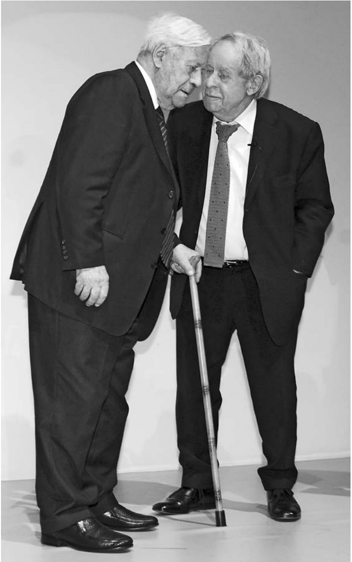
Helmut Schmidt und Siegfried Lenz, Mai 2007