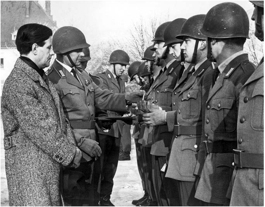
Helmut Schmidt bei der Verleihung der Dankmedaille der Freien und Hansestadt Hamburg an vierhundert Soldaten für deren Einsatz während der Flutkatastrophe, 3. Dezember 1962 in der Litzmann-Kaserne in Hamburg-Wandsbek

Männer angewiesen ist, die auf unkonventionelle Weise die Initiative übernehmen«. 5