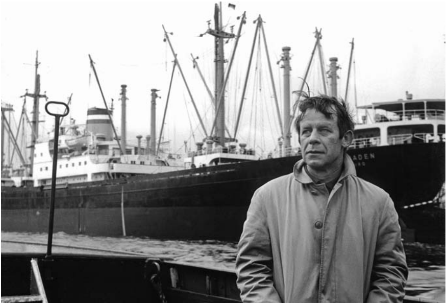
Siegfried Lenz im Hamburger Hafen, 1960er Jahre

haber in Fontainebleau, als Mitglied der »International Defence Community« kannte. Außerdem habe er im Jahr zuvor sein erstes Buch publiziert, »Verteidigung oder Vergeltung«, eine Kritik der Nato-Verteidigungsstrategie. Norstad habe das wohl gelesen und ernst genommen, sodass er nun auch den Anruf des Hamburger Provinzpolitikers ernst nahm und dessen Bitte um Hilfe positiv beantwortete. Hubschrauber der Nato-Truppen wurden eingesetzt, um die Flutopfer zu retten, die auf den Dächern ihrer Häuser oder Schrebergartenhütten in der Kälte ausharrten. Auch die Bundeswehr habe sich de facto ihm unterstellt und seine »aus dem Handgelenk gegebenen Befehle« entgegengenommen. Schmidt: Die wussten, das ist ein Kerl, auf den man sich verlassen kann. In der Nacht davor war die Verantwortung in den Händen der Polizei gewesen. Die Polizeiführung kannte die Generale natürlich auch, aber sie hat hochgesehen zu den Obersten und den Generalen; die waren zwei, drei Ränge höher als die höch-