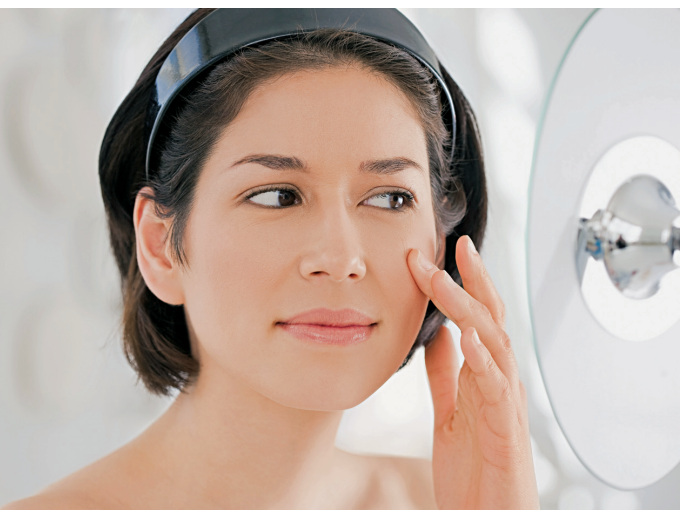
Silizium und Zink – zwei wichtige Bausteine für schöne Haut.

Zink Neben Folsäuremangel ist ein Defizit an diesem Spurenelement die wohl am weitesten verbreitete Mangelerscheinung – und damit Ursache vieler Beschwerden und Krankheiten. Als Bestandteil von rund 300 Enzymen ist Zink an allen Ecken und Enden in unserem Stoffwechsel tätig. So bastelt es z. B. gemeinsam mit Vitamin C Eiweißbausteine zu festem Bindegewebe zusammen, bei Zinkmangel bekommen wir also schnell Falten, Runzeln, Krähenfüße. Das Spurenelement ist auch direkt an der Synthese von sogenannten Neurotransmittern beteiligt, Glückshormonen, die von Gehirn- und Nervenzellen produziert werden. Da wundert es nicht, dass Menschen mit schlechten Nerven und mangelndem Optimismus auch oft über vorzeitige Alterserscheinungen klagen. Enthalten ist Zink in Muskelfleisch, Eigelb, Vollkornprodukten, Naturreis sowie in Austern und anderen Meeresprodukten.