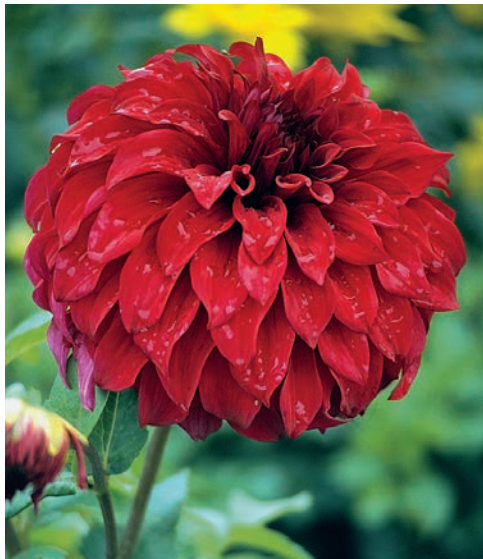
● In Originalgröße abgebildet, würde ‘Spartacus’ als Foto mehr als die ganze Seite ausfüllen.

Mit dem Namen verbindet man etwas Asketisches, Spartanisch-Mageres eben, doch so ist diese Dahliensorte überhaupt nicht. Die Spartaner waren auch große Kämpfer, und dies drückt diese Dahlie aus: Sie prahlt geradezu mit ihrer Größe, ihrer Farbe und ihrer Form. Schön ausgebildete Blüten sehen aus wie ein gut frasierter Lockenkopf, so gleichmäßig liegen die Blütenblätter und formen eine perfekte, große Blüte in einer Farbe voller Glut und Tiefe. Der Sport ‘Vassio Meggos’ sieht gleich aus, in Helllila.