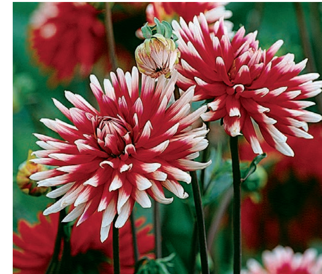
● Eine größere Gruppe von 'Pfitzers Joker' hat eine fantastische Wirkung.

Eine Dahlie, die gleich nach ihrem Erscheinen zum Star wurde. Zur Mainaukönigin gewählt zu werden in jungen Jahren, das heißt schon was. Und bis heute hat sie nichts von ihrer Frische und Fröhlichkeit verloren. Dieser Joker kann im Spiel der Gartenverwendung vielfältig eingesetzt werden und gewinnt immer. Aus einer alten Gärtnerdynastie stammt diese tolle Sorte. Es wurde von Gemüsezwiebeln über Gladiolen zu Dahlien alles gezüchtet, was möglich war und ist im Pflanzenreich.