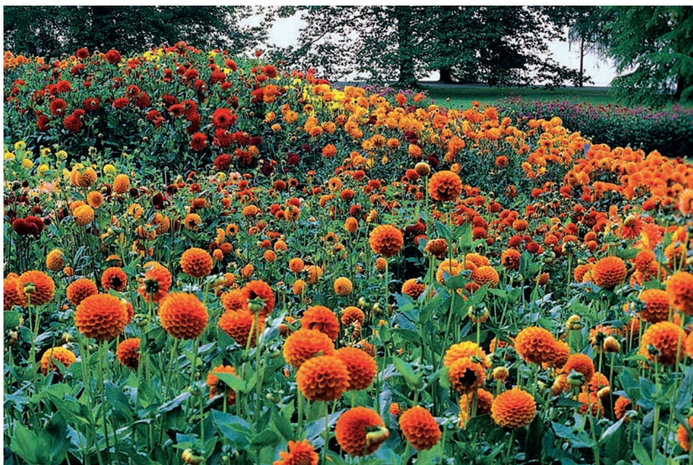
● Ton in Ton sind die Dahliensorten kombiniert. Hier die warmen Farbtöne von Gelb über Orange zu Rot.

Die beste Methode, Dahlien gut in Blüte zu halten , ist meiner Meinung nach das ständige Schneiden von Blütenstängeln für Dahliensträuße. Freudige Ausrufe sind garantiert, wenn Sie Ehemann oder Ehefrau, Freundin und Freund, Nachbarin, Tante und Oma oder wer einem sonst noch an lieben Menschen einfällt, mit bunten Dahliensträußen beglücken. Schneiden Sie ruhig die Stängel etwas länger, etwa 40–50 cm, über die nächste Blattachsel hinaus. Die nachfolgenden Knospen treiben umso kräftiger durch.