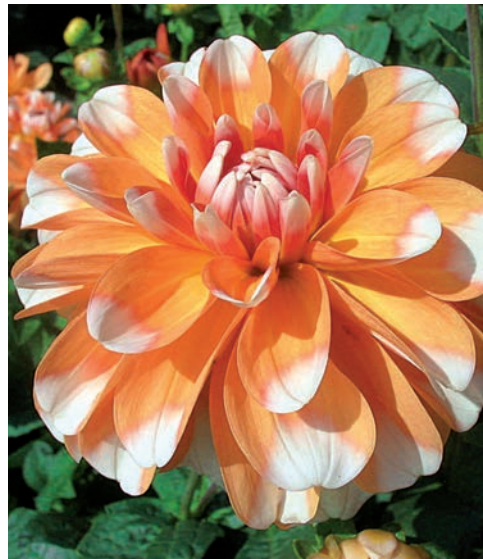
● Wie knusprige, bunte Zuckerstangen wirken die Blüten von ‘Sugar Cane’.

Diese Sorte steht als Vertreterin der modernen zweifarbigen Dahliensorten. Die Grundfarbe wird stark betont durch die weißen Spitzen der Blütenblätter, die wie angemalt wirken. Es gibt diese Art der Dahlie noch in Rot-Weiß (‘Candy Cane’ oder ‘Nagano’), Rosa-Weiß (‘Kyoto’) und Gelb-Weiß (‘Osaka’). Alle haben eine kleine, gefällige Blütenform, die fast in Richtung Seerosenblütige Dahlien geht. Als Solitärpflanze in einem Vorgartenbeet sehr gut geeignet. In der Sonne wirkt sie besonders strahlend.