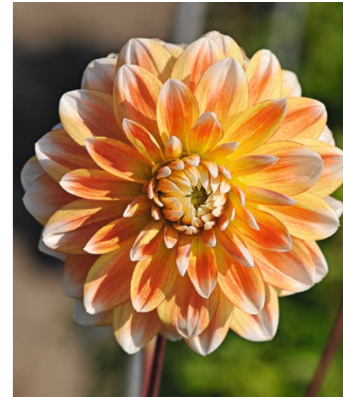
● 'Peaches and Cream' sollte nicht zu sonnig stehen, damit die Farben nicht ausbleichen.

Dreifarbige Dahlien sind selten im Sortiment. Hier eine besonders schöne Sorte. Gelbe Pfirsiche mit Sahne, vielleicht noch etwas Himbeersirup – kaum eine andere Dahlienblüte wird solch ein Bild vor dem inneren Auge entstehen lassen. Dass diese Dahlie dann auch noch gut aussieht im Beet und in der Vase, macht sie zu einer wichtigen modernen Sorte, die aus der »Neuen Welt« in die »Alte Welt« den Weg gefunden hat.