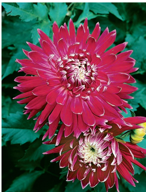
● 'Vancouver', der Sport aus obiger Sorte, in der Form gleich, die Farbe jedoch ganz anders.

namens 'Kalinka' mit dunkelroten Semi-Kaktus-Blüten, die bei einer Höhe von 3,5 m allerdings kaum noch zu sehen sind.