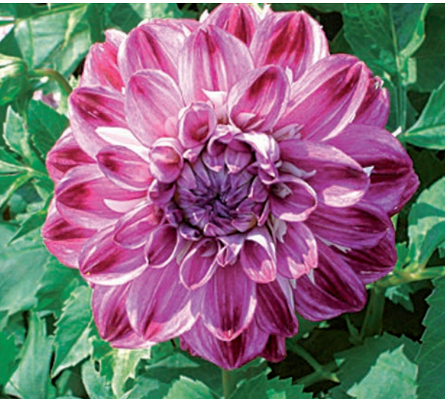
● Ist es nun eine Halskrausen-Dahlie oder eine Dekorative Dahlie? 'Optic Illusion' steht für beide Möglichkeiten.

Eine sehr schöne, farbintensive Sorte. Da Seerosen-Dahlien oftmals nicht zu aufdringlich wirken, können sie gut in Kombination mit Stauden gepflanzt werden. Vor allem aber sollte sie als Schnittblume Verwendung finden, aufgrund ihrer guten Haltbarkeit in der Vase. Eine größere Gruppe dieser reichblühenden Sorte zieht im Garten und auf Ausstellungen alle Blicke auf sich.