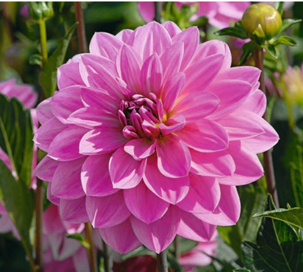
● Dunkelpink ist immer wieder eine Modefarbe. 'Onesta' passt perfekt dazu.