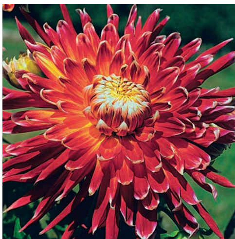
● 'Akita', die Originalsorte in Braunrot aus japanischer Züchtung.