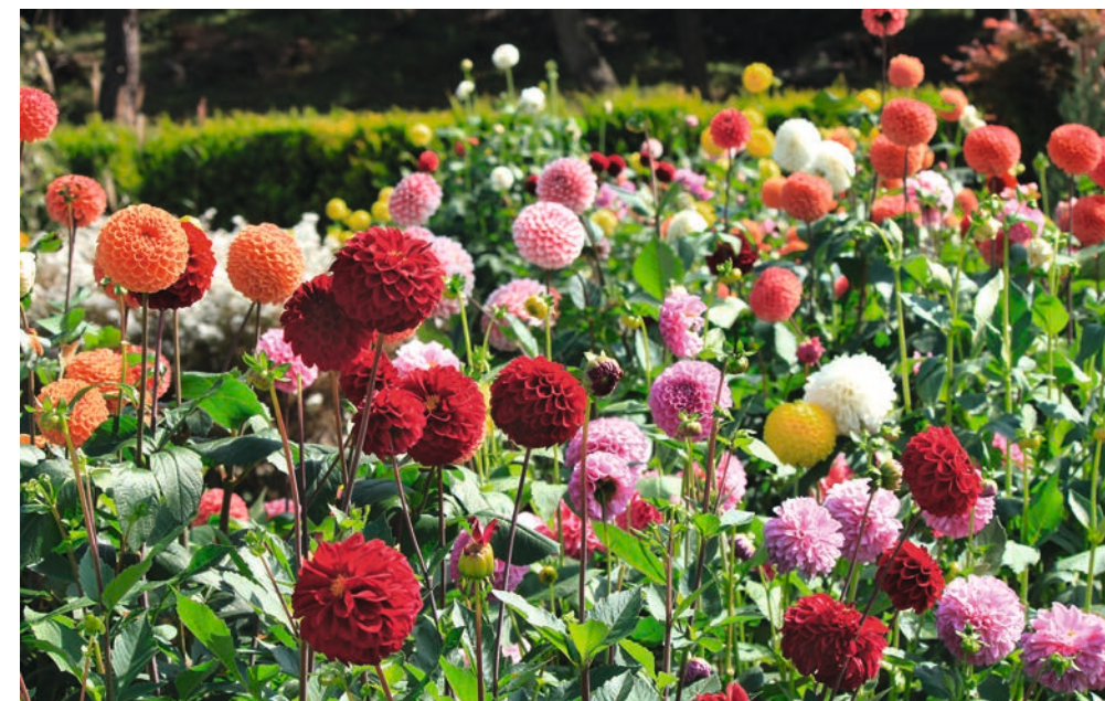
● Ball-Dahlilien gibt es in vielen Farben. Wie schwebende bunte Bälle wirken diese gleichmäßigen Blütenkugeln. Schön wirkt diese Pflanzung aber erst bei guter Pflege: alte Blüten früh wegschneiden!

Großer Beliebtheit erfreuen sich Dahlien, deren Blütenblätter von einer anderen Farbe umrandet sind oder deren Oberseite eine andere Farbe zeigt als die Unterseite, was bei gedrehten Blütenblättern sehr schön zur Geltung kommt. Interessant sind auch immer wieder Sorten, deren Blüten wie mit Farbe bespritzt aussehen. Weiß mit pinkfarbenen Flecken, gelb mit hell-