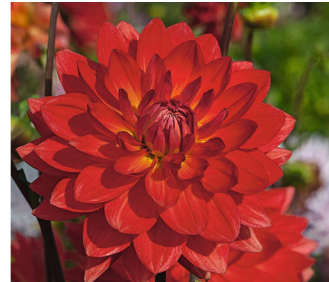
● Ein roter Windvogel aus dem Land der Maori: ‘Taratahi Ruby’.

Wie ein Windvogel, so die Übersetzung aus der Maori-Sprache, ist diese Dahlie von der anderen Seite der Erde zu uns geflogen. Eine der weltweit populärsten Seerosen-Dahlien. Ihre Blüten haben eine Farbe von ungewöhnlicher Leuchtkraft, die schon sehr viele Bewunderer gefunden hat. In großen, bunten Dahliensträußen ist sie der Hingucker, weil das Rot immer hervorsticht. Inzwischen gibt es auch schon verschiedene Sports in Orange und einem dunkleren Rot, die ähnlich schön anzusehen sind.