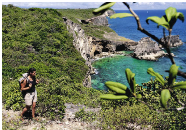
Marie Galante: Der Archipel von Guadeloupe bietet auch schöne Wandermöglichkeiten

Im Parc National, in Guadeloupe > S. 98 westlichem Teil Basse-Terre, gibt es rund 300 km Wanderwege – garantiert genug für die ersten vier Tage. Ausgangspunkt der meisten Wanderungen ist der Ort Saint Claude, dort findet man einfache Hotels und Privatunterkünfte. Etwas komfortabler sind die Hotels an der Küste im 6 km entfernten Basse-Terre (Tipp: Le Jardin Malanga, Tel. 590 92 67 57, www.jardinmalanga.com ; ●●●). Mit dem Auto gelangt man bis zum Parkplatz Savane à Mules, dort beginnen der 90-minütige Aufstieg zum Krater des Soufrière. Auf der Trace Victor Hugues folgt man dem Hauptkamm der Halbinsel auf einer Länge von 29 km, durch Regenwald und vorbei an tropischen Wasserfällen. Einen ersten Überblick über die Wanderwege gibt es unter www.guadeloupe-parcnational.com ;