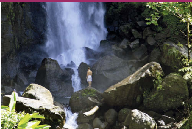
Wasserfall im tropischen Regenwald von Dominica

dem örtlichen Bergsteigerclub kann man sich auch als Tourist anschließen, Exkursionsprogramm unter www.clubdesmontagnards.com (franz.).