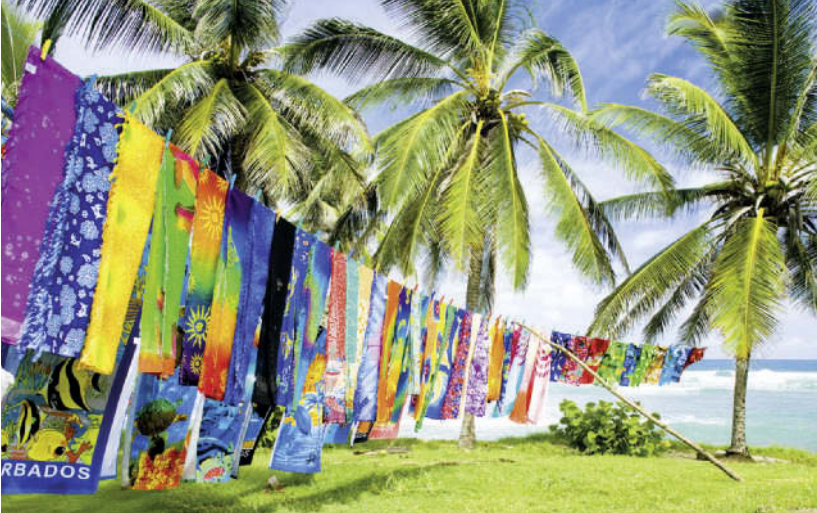
Strandszenerie bei Bathsheba an der Atlantikküste von Barbados