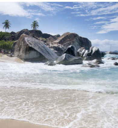
Am Strand The Baths auf Virgin Gorda, BVI

Die Französischen Antillen , also Guadeloupe und Martinique, zählen zusammen mit ihren kleineren Nachbarn als Übersee-Départements zur Euro-Zone; ihre Attraktionen sind Vulkane, fruchtbares Grün, Strände und nicht zuletzt die feine französisch-creolische Küche.