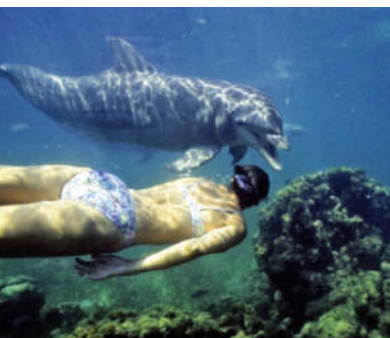
Schwimmen mit Delfinen ist ein einmaliges Erlebnis – möglich auf vielen Antilleninseln

Dem Trend zum naturnahen Urlaub entsprechen viele Karibik-Destinationen durch den Ausbau von Wanderwegen durch Regenwald und auf Vulkankegel. Besonders schön: Jamaika, Puerto Rico und die Windward Islands. Einige empfehlenswerte Wanderungen werden in Form von Kurzbeschreibungen in den jeweiligen Inselkapiteln vorgestellt › auch S. 13. Absolute Pflicht in den Tropen: Sonnenschutz, reichlich Trinkwasser und feste Schuhe – die Wege sind durchaus beschwerlich. Wanderkarten sucht man vergeblich, am besten erkundigt man sich vor Ort in den Nationalpark- oder Tourismus-Infobüros.