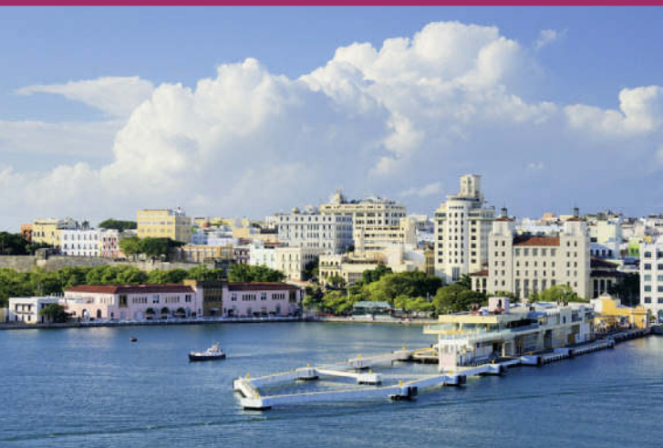
Skyline und Hafen von San Juan, Puerto Rico

Diese Tour kombiniert zwei Inseln der Großen Antillen, wie sie unterschiedlicher kaum sein könnten. Nach der Ankunft in Jamaika bietet es sich an, zwei bis drei Nächte lang in Montego Bay › S. 48 zu bleiben, z. B. an den Stränden Cornwall Beach oder Doctor's Cave, um sich an das Klima und den jamaikanischen Lebensrhythmus zu gewöhnen und eine Reggae-Disko zu besuchen. Tagsüber ansehen sollte man sich das historische **Rose Hall Great House , zum Lunch oder zur Tea Time lohnt sich ein Ausflug zum **Good Hope Great House . Der vielleicht schönste Strand Jamaikas erstreckt sich auf 11 km bei Negril › S. 53 – sonst gibt es zwar nicht viel zu sehen, zwei Nächte kann man aber gut bleiben. Dies gilt auch für Ocho Rios › S. 51 mit seinem schönen Turtle Beach und v. a. den weltberühmten Dunn's River Falls. Wahlweise kann man auch in **Port Antonio › S. 52 übernachten, dem sympathischen Hafenstädtchen in Schatten der **Blue Mountains › S. 58.