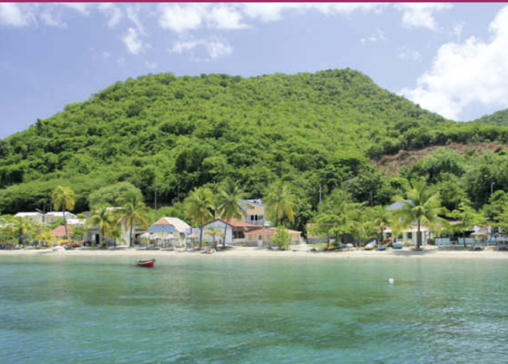
EU-Außenstelle: im französischen Überseedépartement Martinique