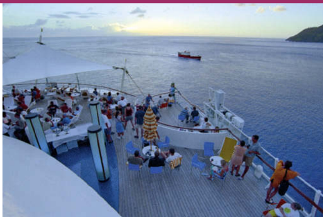
Auf Karibikkreuzfahrt mit dem Klubschiff »Aida«

Mietwagen werden überall angeboten, auch von kleinen lokalen Vermietern (Büros z. B. an Flughäfen). Es ist auf jeden Fall ratsam, eine Vollkaskoversicherung ( collision damage waiver – CDW ) abzuschließen. Die Tagespreise für Kleinwagen ohne Kilometerbegrenzung liegen bei 50–70 US- \text{\$} ; eine Kreditkarte wird bei der Anmietung vorausgesetzt. Die meisten Inseln verlangen ferner eine nationale Fahrerlaubnis, die man gegen Vorlage des Führerscheins und nach Entrichtung einer Gebühr (ca. 10 €) erhält.