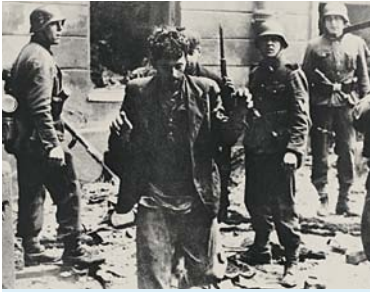
Deutsche Truppen verhaften jüdische Widerstandskämpfer im Warschauer Getto