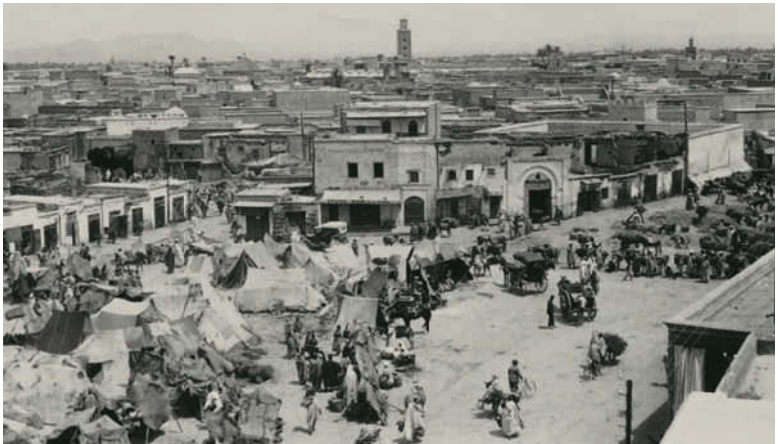
Zeltlager vor den Toren von Marrakesch, Anfang des 20. Jahrhunderts.

1672–1727 Moulay Ismail ›befriedet‹ das Land mit seiner Armee von schwarzen Sklaven. Seine Residenz errichtet er in Meknes, wo zahlreiche Bauwerke bis