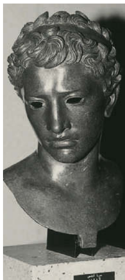
Büste Jubas II., Statthalter Roms im fernen Mauretania, Musée Archéologique, Rabat

7./8. Jh. Arabisch-islamische Eroberung. Oqba ibn Nafi dringt 681 bis an die Atlantikküste vor. Ein groß angelegter Feldzug beginnt 710 unter der Leitung von Musa ibn Nusair. Tariq ibn Zeyad, nach dem der Felsen von Gibraltar benannt wurde (Djebel Tariq), marschiert mit einer Truppe arabischer