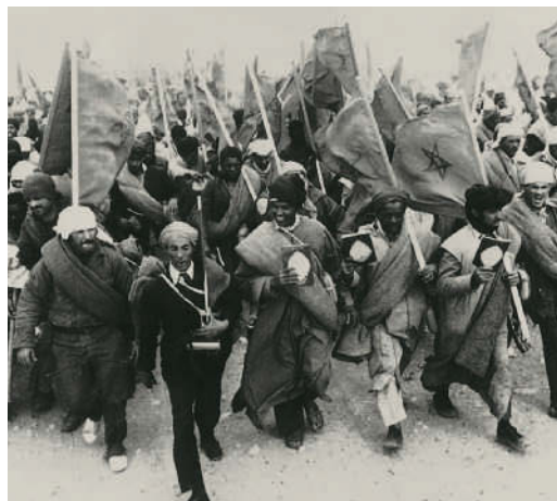
Beim »Grünen Marsch« im Jahr 1975 überschreiten 350 000 Marokkaner mit dem Koran in der Hand die Grenze zur Westsahara

1953 Im August wird in Marrakesch bei einer Versammlung der Caidis unter der Leitung des gegen den Thron intrigierenden Glaoui, Pascha von Marrakesch, der Sultan für abgesetzt erklärt. Seine Söhne und er werden ins Exil nach Madagaskar geschickt.