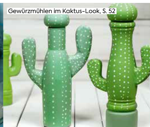
Gewürzmühlen im Kaktus-Look, S. 52