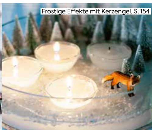
Frostige Effekte mit Kerzengel, S. 154