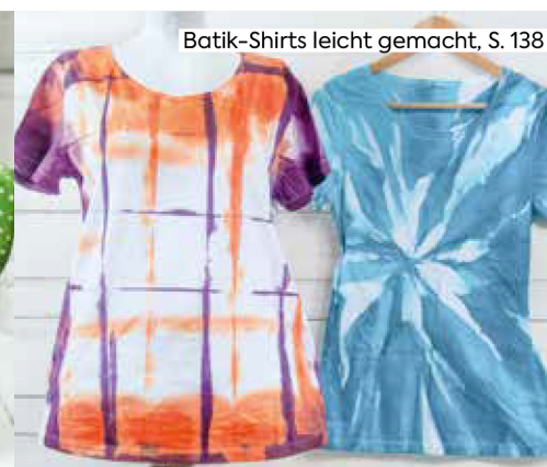
Batik-Shirts leicht gemacht, S. 138