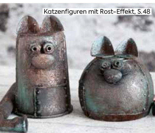
Katzenfiguren mit Rost-Effekt, S.48