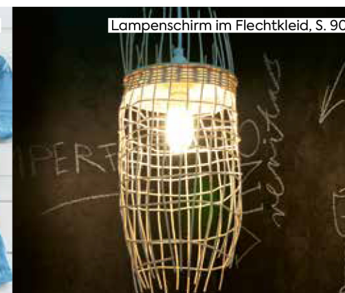
Lampenschirm im Flechtkleid, S. 90