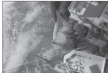
Schritt 4: Schutzfolie abziehen und die Perlen auf der Leinwand aufkleben.