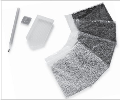
Schritt 1: Werkzeug bereitlegen.