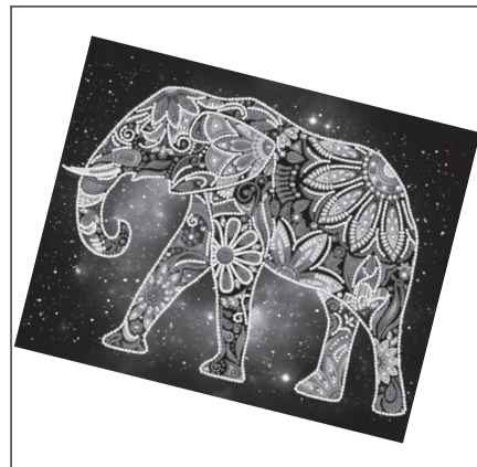
Schritt 6: Die Leinwand mit etwas Klebstoff bestreichen, damit die Perlen gleichmäßig anhaften.